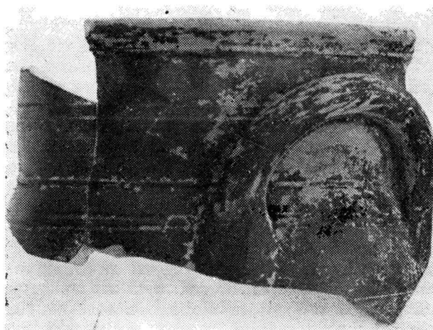
Fig. 3. Histria-Pod 1980. Fragment de crater histrian.

Fig. 2. Histria Pod. 1981. La section vue de l'est.