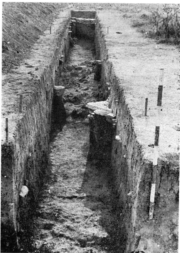
Fig. 2. Histria-Pod 1981. Secțiunea dinspre E.

Fig. 1. Histria Pod 1980. La section vue du NE.